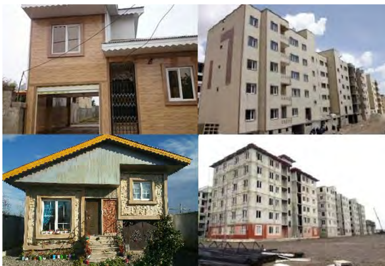
شکل ۳ تصاویری از مسکن بر اساس طراحی شخصی و دولتی در شهرستان‌های مورد مطالعه‌ی استان گیلان