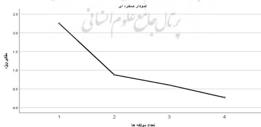
شکل ۲ - نمودار صخره‌ای مربوط به متغیر توسعه کالبدی شهر حاجی‌آباد برای تعیین تعداد عامل‌ها

در جدول شماره ۱۰، میزان مقادیر ویژه عامل‌های مربوط به مؤلفه‌های توسعه کالبدی به‌صورت کلی نمایش داده شده است. مقادیر ویژه تعیین‌کننده عامل‌هایی که در تحلیل باقی می‌مانند و در واقع مقادیر ویژه مجموع مربع بارهای عاملی هر عامل است. عامل‌هایی که مقدار ویژه آنها بالاتر از ۱ باشد، به‌عنوان مهم‌ترین عامل‌ها شناخته می‌شوند و در تحلیل عاملی باقی می‌مانند و عواملی که مقدار ویژه