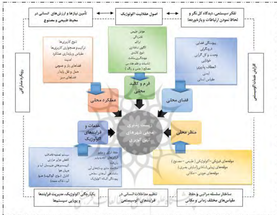
شکل(۳): تطبیق اصول عقلانیت اکولوژیک با معیارها و زیرمعیارهای زیست‌پذیری در مقیاس محلی

به منظور پاسخ به سوال اول پژوهش، مبنی بر رسالت عقلانیت اکولوژیک در ارتقاء زیست‌پذیری، به قیاس این دو رویکرد و تطبیق اصول عقلانیت اکولوژیک با معیارها و زیرمعیارهای زیست‌پذیری در مقیاس محلی پرداخته شده است. مدل مفهومی حاصل (شکل ۳)، بر تطبیق این دو رویکرد و رسالت عقلانیت اکولوژیک در ارتقاء زیست‌پذیری تأکید دارد.