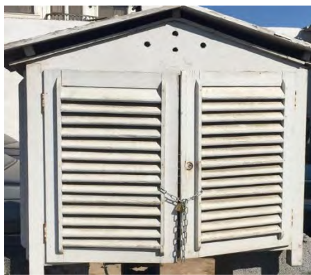
شکل ۳ جعبه نگهداری دیتالاگر ثبت داده

برای رعایت شرایط یکسان دستگاه‌های اندازه‌گیری، جعبه چوبی مشبکی که جریان هوا بتواند از آن عبور کند، مطابق استاندارد سازمان هواشناسی تهیه و استفاده شد. جعبه پایش در ارتفاع حدود ۱/۵ متری از سطح زمین قرار داده شد (شکل ۳).