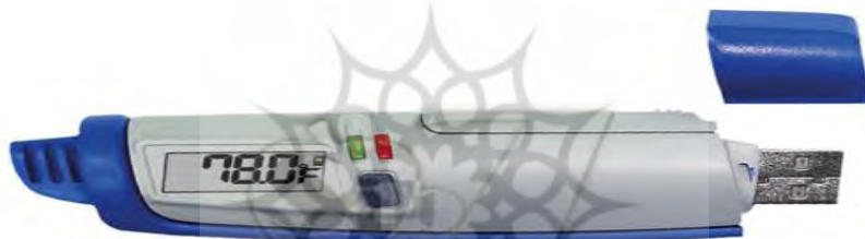
شکل ۱ دیتالاگر مورد استفاده برای ثبت داده‌های دما در بابلسر

شکل ۱) در فواصل زمانی متفاوت در دو محیط شهری (سازمان مرکزی دانشگاه مازندران و اداره کشاورزی بابلسر) و یک فضای برون شهری (پردیس دانشگاه مازندران) نصب شد (شکل ۲).