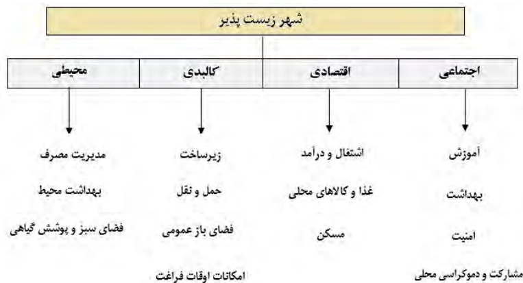
شکل (۲) شاخص‌های و عوامل دست‌یابی به شهر زیست‌پذیر