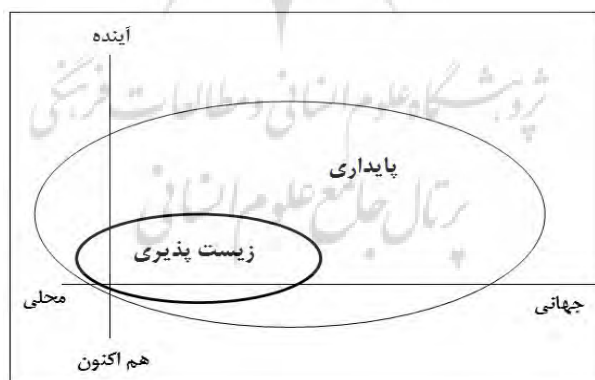
شکل (۱) زیست‌پذیری به‌عنوان زیرمجموعه پایدار