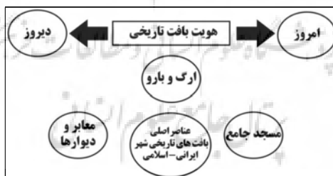
شکل شماره ۱: عناصر اصلی بافت‌های تاریخی شهر ایرانی-اسلامی

با توجه به موارد مطرح‌شده، بافت‌های فرسوده امروزه با توجه به روندهای نوگرایی و فرانوگرایی در حال جریان در بستر کالبدی و فرهنگی شهرها، بافت ناکارآمد و چالش‌آفرین برای مدیریت و برنامه‌ریزی در شهرها قلمداد می‌شوند (Baek & Park, 2012). بافت‌های فرسوده، جزئی از پیکره و بدنه شهرهاست و دارای ارزش تاریخی و فرهنگی، کالبدی، عملکردی و اقتصادی است (Durgesh, 2004: 98). مهم‌ترین ویژگی‌های شهر ایرانی اسلامی که بایستی در نوسازی بافت با این رویکرد مورد توجه قرار گیرد، شامل ویژگی‌های چون بازار، مسجد، حد و حریم، تعادل و توازن، حس تعلق به مکان و امنیت است. شکل شماره ۱ هویت بافت تاریخی و عناصر اصلی این نوع بافت‌ها در شهرهای ایرانی اسلامی را نشان می‌دهد.