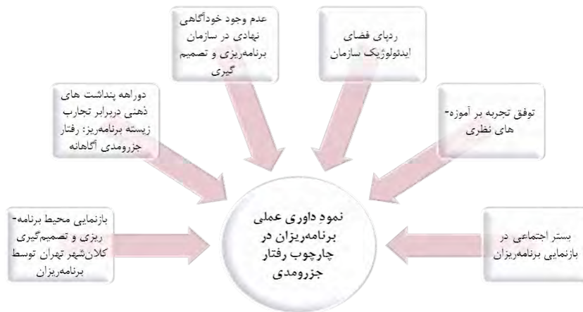
شکل (۳). مقولهٔ مرکزی بر ساخت‌شده از زیرمقوله‌ها