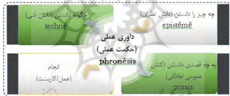
شکل (۱). برنامه‌ریزی به‌مثابهٔ کاربست دانستن