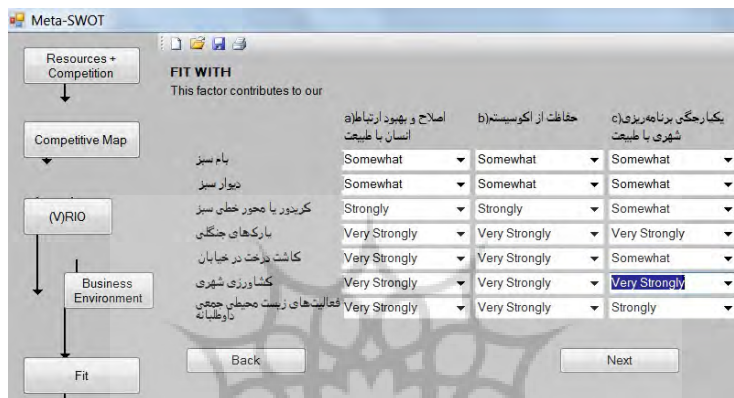
شکل ۳: میزان تأثیرگذاری قابلیت‌ها بر اهداف شهر بیوفیلیک

محسوب می‌شود. در ارتباط با سایر منابع نیز این نتیجه حاصل شد که دیوار سبز، کریدورهای خطی سبز و کاشت درخت در خیابان، به میزان زیادی تحت تأثیر اولویت‌دادن به توسعه زیست محیطی و اختصاص بودجه قرار دارند. همچنین عوامل محیطی تأثیر اندکی بر فعالیتهای زیست‌محیطی ساکنین به صورت جمعی و داوطلبانه دارد. سپس، میزان تأثیر منابع و توانایی‌ها بر اهداف تعیین شد (شکل ۳). بر اساس این ارزیابی، پارک‌های جنگلی، کاشت درخت در خیابان، کشاورزی شهری و فعالیتهای زیست محیطی ساکنین، به میزان بسیار زیادی بر دو هدف اصلاح و بهبود ارتباط انسان با طبیعت و همچنین حفاظت از اکوسیستم تأثیرگذار هستند. همچنین دو قابلیت پارک‌های جنگلی و کشاورزی شهری نیز تأثیر بسیار زیادی بر یکپارچگی برنامه‌ریزی شهری با طبیعت دارند.