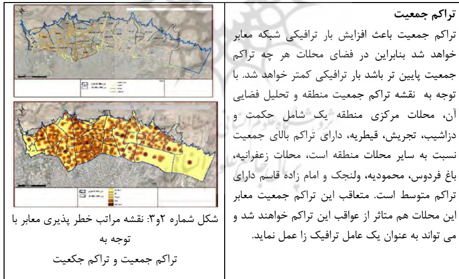
جدول شماره ۲: سنجش ریسک وقوع خطر در شبکه معابر به لحاظ عوامل انسانی

شاخص‌های انسان ساخت تحلیل تاب آوری کالبدی شبکه معابر در پژوهش حاضر شامل متغیرهای مکانی مانند دوری و نزدیکی به تاسیسات، مراکز شاخص شهری، کاربری‌های نظامی، همجواری با شبکه‌های شهری مانند آب و برق و گاز، بافت فرسوده و مراکز مدیریت بحران و ... است.