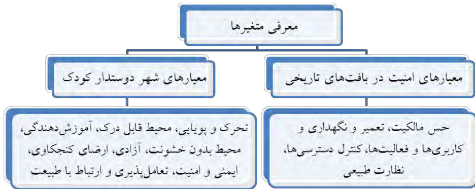
شکل ۲: معرفی متغیرهای پژوهش