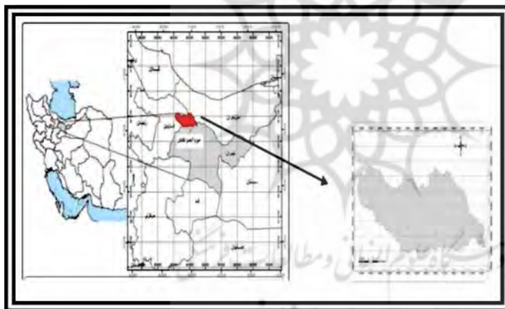
نقشه شماره ۱: موقعیت شهرستان طالقان

طالقان یکی از شهرهای مهم ساوجبلاغ است که منطقه نمونه گردشگری درون آن واقع می‌باشد. این شهر با مختصات جغرافیایی ۵۰ درجه و ۲۹ دقیقه تا ۵۱ درجه و ۸ دقیقه طول شرقی و ۳۶ درجه و ۱۷ دقیقه عرض شمالی در قسمت شمال غربی شهرستان ساوجبلاغ و در ناهمواری‌های رشته کوه البرز جای گرفته است و جزء مناطق کوهستانی محسوب می‌شود از نظر تقسیمات سیاسی این شهر از سه دهستان بالا طالقان، میان طالقان و پایین طالقان و ۸۵ آبادی تشکیل شده است که اکثر آبادی‌ها در اطراف و امتداد رودخانه طالقان رود استقرار یافته‌اند. در این میان دهستان میان طالقان بیشترین تراکم آبادی‌ها را به خود اختصاص داده است. جمعیت شهر طالقان، ۳۴۱۶ نفر بوده است که از این تعداد، ۱۸۱۴ نفر را مرد و ۱۶۰۲ نفر را زنان تشکیل داده‌اند، یا به عبارتی دیگر، ۵۳/۱ درصد را مردان و ۴۶/۹ درصد را زنان تشکیل داده‌اند این شهر علاوه بر جاذبه‌های طبیعی که شامل (اقلیم و آب و هوای منطقه، دریاچه‌ها، رودها و رودخانه‌ها و چشمه‌ها، رشته کوه‌ها و قلعه‌ها، غارها و دخمه‌ها، مناظر زیبا، دره‌ها و چشم اندازه‌های دیدنی، پوشش گیاهی، گونه‌های جانوری) دارای منابع و جاذبه‌های فرهنگی و اماکن باستانی، تاریخی نیز در دل خود جای داده است.