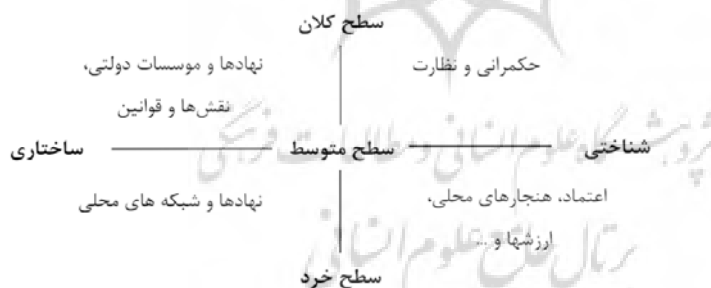
شکل ۱: اشکال و قلمرو سرمایه اجتماعی (Basile and Cecchi, 2007:4)

امروزه سرمایه اجتماعی نقش بسیار مهم‌تری از سرمایه‌های فیزیکی و انسانی در سازمان‌ها و جوامع ایفا می‌کند و شبکه‌های روابط جمعی و گروهی، انسجام میان افراد، و بین افراد و سازمانها را برای افزایش اثر بخشی فعالیت‌های توسعه‌ای را در بر می‌گیرد (خمر و همکاران، ۱۳۹۰) و در نقش یک خرد جمعی و مسئولیت مدنی ظاهر شده و جامعه را به چیزی بیشتر از مجموعه افراد تبدیل می‌کند (Gootaert, 1998:5). بنابراین، سرمایه اجتماعی، که روابط خرد در درون یک شهر را توصیف می‌کند، ممکن است بر روی ظرفیت مدنی، و یا روابط کلان بین بخش‌های مدیریتی، اجرایی و مردم تاثیر گذاشته و ساختار قدرت، بهره‌وری و مشارکت و تنوع روابط را تحلیل کند (Ognibene, 2010:3). سرمایه اجتماعی در سطوح مختلف عملکردی (سطح خرد، میانی و کلان) مد نظر است و می‌تواند با ایجاد تغییرات ساختاری و شناختی، به عنوان یک کالای عمومی، رابطه متقابلی با توسعه داشته باشد (ساروخانی، ۱۳۸۷ و Basile and Cecchi, 2007:2). بنابراین، سرمایه اجتماعی "توانایی تشکیل و حفظ روابط به منظور تسهیل دستیابی به اهداف" از طریق توسعه ارتباطات و همکاری به‌عنوان نقطه مرکزی سرمایه‌گذاری در توسعه محلی می‌باشد (Hazelton et al., 2007:92). به‌عبارت دیگر، ایده سرمایه اجتماعی می‌تواند به عنوان "محصول سرمایه‌گذاری عمدی در روابط با دیگران و کاربرد آن در دسترسی متفاوت به منابع نهفته باشد ... و می‌تواند منافع فردی و گروهی را مد نظر قرار داده و عملکرد تعریف شده سیاسی و اجتماعی را تسهیل کند (Brunie, 2009,3.1.1). مطابق شکل (۱) سرمایه اجتماعی به‌عنوان یک کالای عمومی، رابطه متقابلی با توسعه در سطوح مختلف دارد.