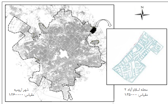
شکل ۱- موقعیت محدوده مورد مطالعه در شهر ارومیه

ساکنان این محدوده مهاجرین وارد شده از دیگر نقاط استان به ویژه روستاها و شهرهای شمالی استان (ماکو، پلدشت و ...) هستند. اگر چه در طی سال‌های اخیر جابه‌جایی‌های گسترده‌ای نیز در سطح محدوده رخ داده و افرادی که در دیگر نقاط شهر سکونت داشتند به آن وارد شده‌اند؛ با این حال محدوده مورد بررسی از یکپارچگی فرهنگی و قومی برخوردار است.