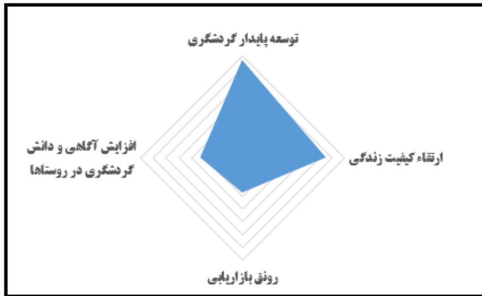
شکل ۴- رتبه‌بندی پیامدهای توسعه گردشگری

مطابق نتایج به دست آمده در جدول (۷)، به ترتیب پیامدهای توسعه پایدار گردشگری با مقدار وزن ۷۲/۵۴ ، ارتقاء کیفیت زندگی با مقدار وزن ۷۲/۳۱ ، افزایش آگاهی و دانش گردشگری در ناحیه با مقدار وزن ۷۱/۶۶ ، رونق بازاریابی با مقدار ۷۱/۵۴ ، بااهمیت‌ترین و بی‌اهمیت‌ترین پیامدها را به خود اختصاص داده‌اند.