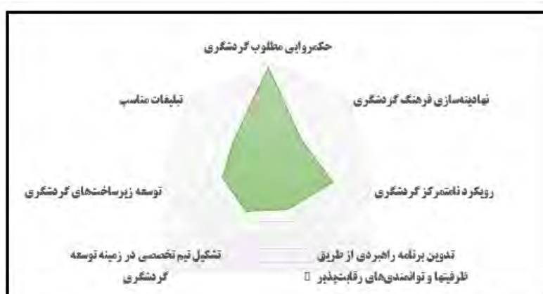
شکل ۳- رتبه‌بندی بسترهای حاکم بر توسعه گردشگری