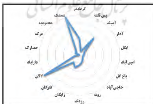
شکل ۲- رتبه‌بندی روستاهای ناحیه بر اساس شاخص‌های گردشگری

در ادامه نیز برای تعیین توان رقابت‌پذیری ناحیه کوهستانی رودبار قصران در زمینه گردشگری، در ابتدا به بررسی بسترهای حاکم بر توسعه گردشگری با تاکید بر مزیت‌های رقابت‌پذیری پرداخته شد، و در ادامه نیز پیامدهای توسعه گردشگری بر مبنای مزیت‌های رقابت‌پذیری با استفاده از روش تئوری زمینه‌ای مورد بررسی قرار داده شد.