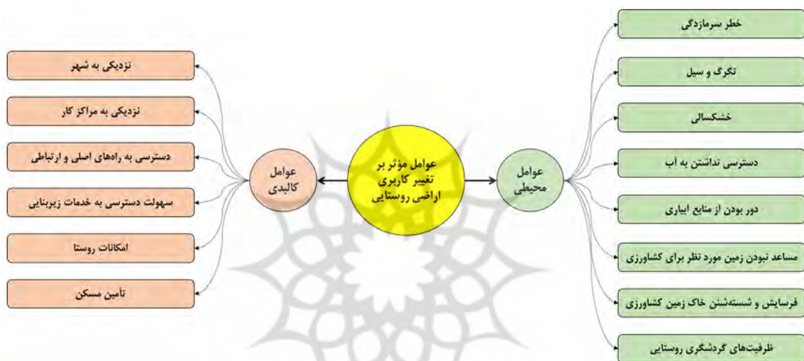
شکل ۱. مدل مفهومی عوامل کلیدی و محیطی مؤثر بر تغییرات کاربری زمین روستایی