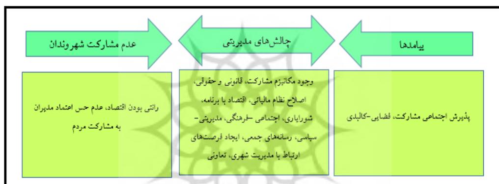
شکل ۲. دسته‌بندی مضامین اصلی، منبع: یافته‌های پژوهش، ۱۴۰۰

این مقوله به سه دسته مفاهیم انتزاعی‌تر (مضمون) تقسیم می‌شوند، برخی از آنها به عوامل شکل‌گیری عدم مشارکت شهروندان در مدیریت شهری اشاره کرده‌اند، برخی چالش‌های مشارکت را در مدیریت شهری و برخی نیز به پیامدها پرداخته‌اند در ابتدا به مقوله‌هایی می‌پردازیم که علت ایجاد عدم مشارکت شهروندان بوده‌اند. این مقولات عبارتند از: رانتی بودن اقتصاد و قرار گرفتن بخش عظیمی از سرمایه در دست صاحبان مشاغل و شرکت‌های دولتی، عدم حس اعتماد مدیران به مشارکت مردم می‌باشد. مقوله‌های مربوط به چالش‌های مدیریتی شامل: وجود مکانیزم مشارکت، قانونی-حقوقی، اصلاح نظام مالیاتی، اقتصاد با برنامه یا اقتصاد راهبردی، شورایاری، تعاونی‌ها، اجتماعی و فرهنگی، اطلاع‌یابی، مدیریتی و سیاسی، رسانه‌های جمعی، ایجاد فرصت‌های ارتباط با مدیریت شهری) می‌باشند.