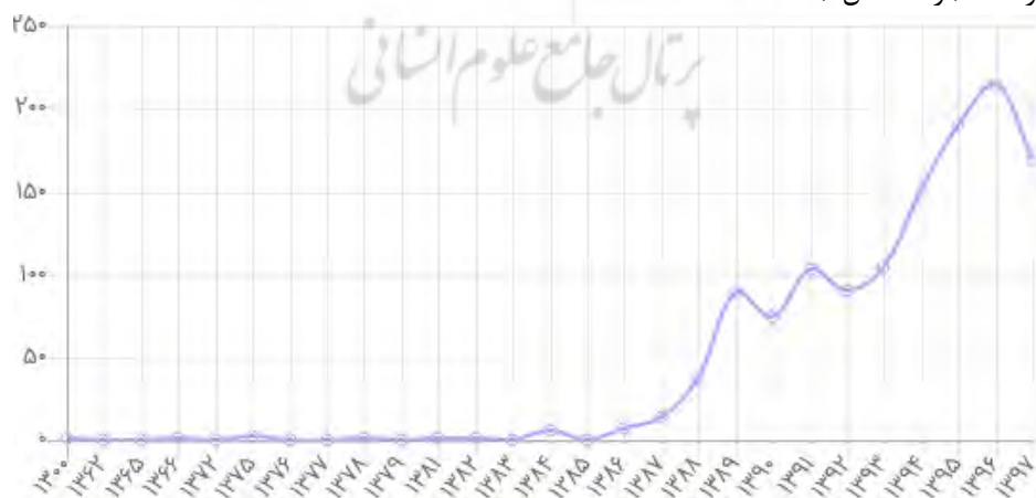
شکل ۱. روند پژوهش‌های پایان‌نامه‌های کارشناسی ارشد و دکتری در موضوع بافت فرسوده شهری (۱۳۰۰-۱۳۹۷.ش)