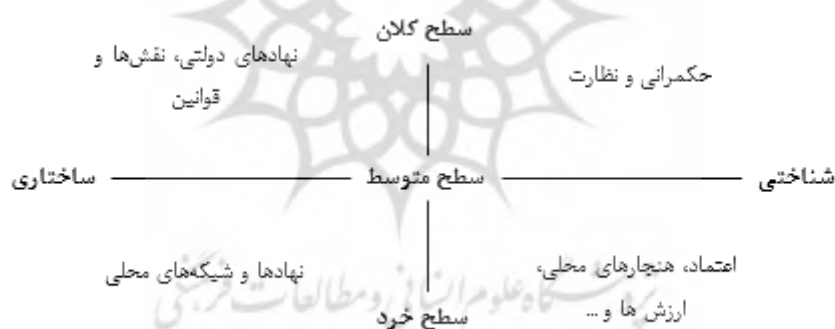
شکل ۱. اشکال و قلمرو سرمایه اجتماعی (Basile and Cecchi, 2007: 4)

سرمایه اجتماعی در سطوح مختلف عملکردی شامل سطح خرد (ناظر بر رفتار شبکه‌هایی از افراد و خانواده‌ها)، سطح میانی (پیوندها و روابط عمودی) و سطح کلان (رسمی ترین روابط و ساختارهای نهادی) مدنظر است و می‌تواند با ایجاد تحولات شناختی و ساختاری که مکمل یکدیگر هستند، به عنوان یک کالای عمومی، ارتباط متقابلی با توسعه داشته باشد (ساروخانی، ۱۳۸۷: ۴۳). در واقع اشکال ساختاری سرمایه اجتماعی بر روابط بین انسان و نهادها تأکید می‌کند و مواردی از قبیل قوانین، شبکه‌های اجتماعی، انجمن‌ها، نهادها، نقش‌ها و رویه‌ها را در بر می‌گیرد که با حکمرانی و نظارت، ارزش‌ها، اعتماد، هنجارها و ... که بیشتر جنبه شناختی دارند (شکل ۱)، تکمیل می‌شوند (Krishna and Nor-man, 1999: 174).