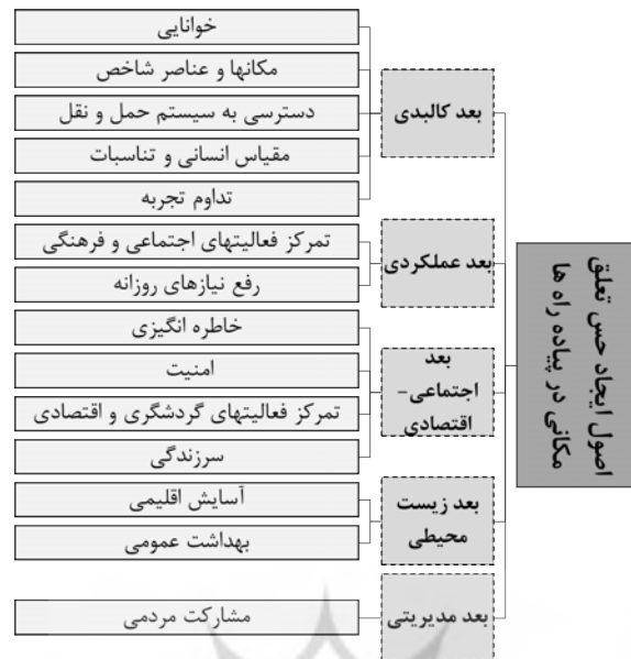
شکل ۲. اصول ایجاد حس تعلق مکانی در پیاده‌راه‌های شهری