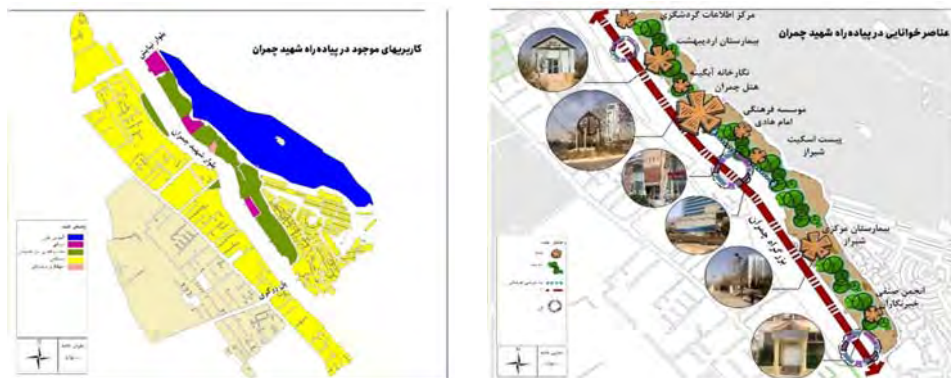
شکل ۳. محدوده مورد مطالعه (مأخذ: نگارندگان به کمک نقشه‌های جی‌آی‌اس شهر شیراز)