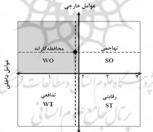
شکل ۴. تعیین منطقه راهبردی منتخب به کمک ماتریس IE

با توجه به نتایج به‌دست‌آمده از ماتریس‌های ارزیابی، نمره نهایی ماتریس ارزیابی عوامل داخلی ۱،۹۴۷ و نمره نهایی ماتریس ارزیابی عوامل خارجی ۲/۵۷۵ محاسبه شده است. این دو رقم در نمودار IE وارد شده و ناحیه استراتژی مرجع را نشان می‌دهد. از نتایج حاصل شده از این ارزیابی و مقایسه آن با مقدار میانگین، عدد ۲/۵ می‌توان دریافت که پیاده‌راه شهید چمران باتوجه به