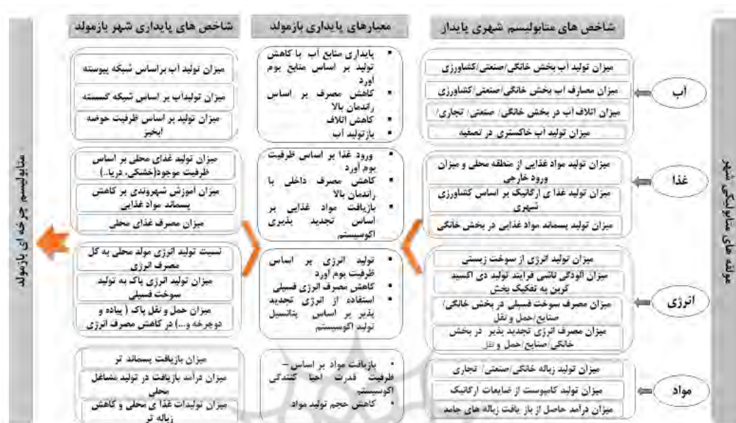
شکل ۳: چارچوب پیشنهادی شاخص‌های سنجش متابولیسم شهر پایدار با رهیافت شهر باز مولد

منطقه محلی و مناطق دور برد را با هدف تقویت اقتصاد محلی، حفظ سرمایه‌های محیطی و باز تولید غذا، مدنظر قرار می‌دهد. درک جریان مواد غذایی از طریق سیستم شهری برای استراتژی‌های موفق مدیریت منابع غذایی برای پرداختن به مسائلی مانند تغذیه، رهاسازی فلزات سنگین به زمین‌های کشاورزی، باران اسیدی و آلودگی آب‌های زیرزمینی حیاتی است (Oliveira and Vaz, 2021).