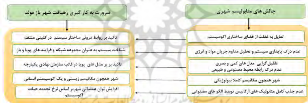
شکل ۲: چالش‌های متابولیسم شهری و ضرورت به کارگیری رهیافت شهر بازمولد