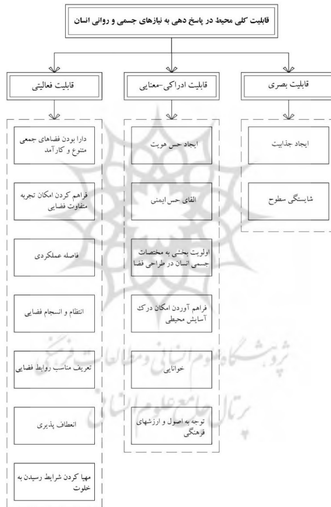
نمودار ۲. نمودار نمایشگر عامل محوری پژوهش و مقولات و مفاهیم مرتبط با آن

توجه داشت و در این راستا، دسته‌بندی‌های متفاوتی از عواملی که در بروز این قضیه مؤثرند شکل گرفت. هرچند در این خصوص، میزان تأثیر همه این عوامل، به یک‌میزان، از سمت مصاحبه‌شوندگان برآورد نشده است، ولی در یک دسته‌بندی کلی از عوامل مورد اشاره، مشخص شد بیشتر عواملی که از طرف مصاحبه‌شوندگان مورد تأکید قرار می‌گرفتند، در دسته عوامل بعد قابلیت فعالیتی فضا بودند (نمودار ۲). نکته قابل توجه دیگر، معرفی عواملی است که در