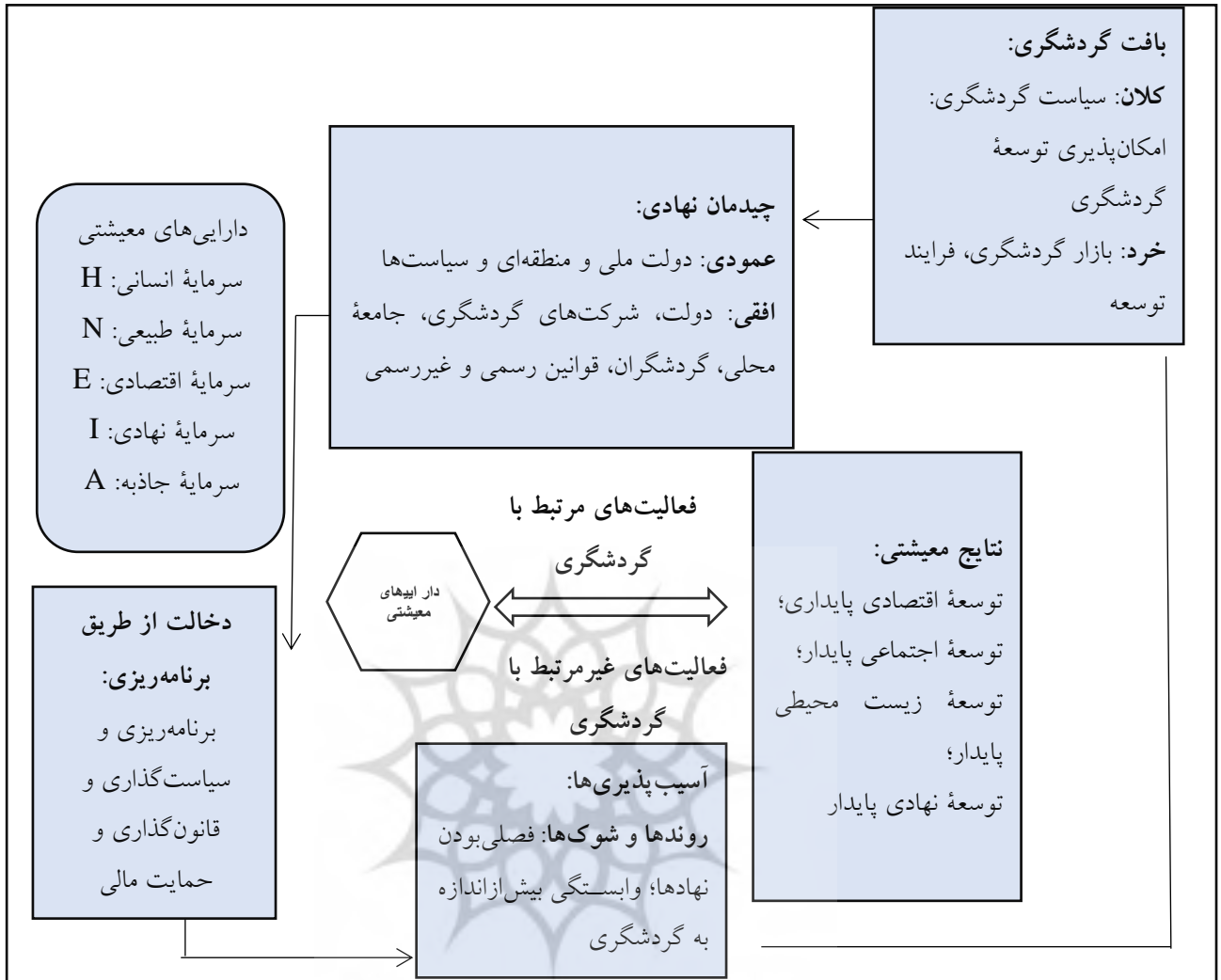
شکل ۲: چارچوب مفهومی معیشت پایدار روستایی (Shen et al., 2008) به نقل از احمدی و جمعه‌پور، ۱۳۹۰، ص ۴۲؛ اعظمی و هاشمی امین، ۱۳۹۶، ص ۱۰۵)