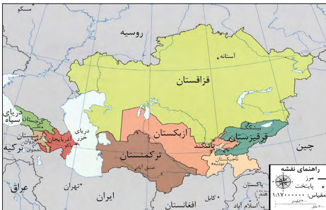
شکل ۱. نقشه آسیای مرکزی و قفقاز