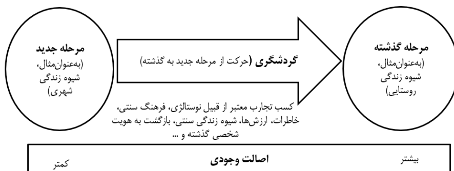
شکل ۱. مفهوم بازگشت به هویت گذشته از طریق گردشگری (اقتباس از Cai et al, 2018:83)

در مباحث مرتبط با هویت سکونتگاه‌ها، که بیانگر ساخت اجتماعی-فرهنگی یک جامعه است که توسط ترکیبی از عوامل مختلف مانند شرایط تاریخی، قومی و جغرافیایی شکل می‌گیرد (Lamopia, 2019:263; Dinis et al., 2019:92). توسعه گردشگری با بهره‌گیری از مفهوم هویت مکان در قالب بازگشت به حقیقت و اصالت در دو مفهوم مطرح می‌شود (Cai et al, 2018:83): ۱- کاهش فشار ناشی از تصویرسازی مطلوب از خود برای افراد دیگر (خود غیرواقعی) و پیروی از هنجارهای اجتماعی زندگی شهری و تعاملات پیچیده و غیرواقعی (توأم با نگرانی‌ها موجود) و ۲- ویژگی‌های حاکم بر جوامع روستایی (آزادی از استرس، تعامل اجتماعی و روابط واقعی، دارا بودن اصالت، رهایی از نقش‌های تصنعی و ...). از دیدگاه کای و همکاران (۲۰۱۸: ۸۲) تجربه اصالت ناشی از هویت مقاصد روستایی باعث می‌شود که فرد با شخصیت‌های اجتماعی عادی و اصیل و محیط غیر تصنعی ارتباط بیشتری برقرار کند که از این پدیده در گردشگری به‌عنوان "فرار یا رهایی" با حذف نگرانی خودنمایی در زندگی شهری و ایفای نقش‌های متفاوت (که ممکن است در محیط شهری مورد پذیرش قرار نگیرد) می‌باشد که در شکل (۱) مورد توجه قرار گرفته است.