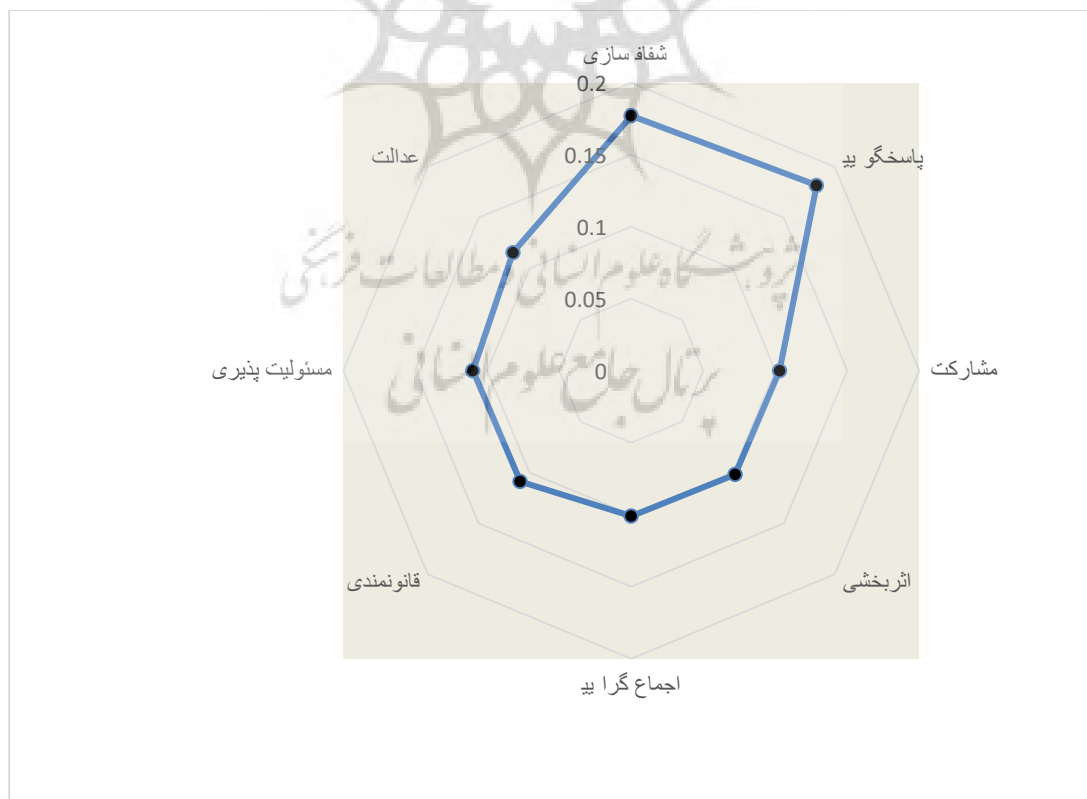
شکل ۲: نمودار مقایسه وزن شاخص های حکمروایی خوب شهری