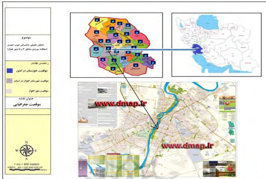
شکل ۱: نقشه موقعیت جغرافیایی محدوده مورد مطالعه

منطقه ۴ از غرب به مسیر پل ششم حدفاصل رودخانه کارون تا بلوار ساحلی، خیابان شهید بهشتی حد فاصل بلوار گلستان تا راه آهن، از شمال بلوار گلستان مسیر پل ششم تا خیابان شهید بهشتی، راه آهن حد فاصل خیابان شهید بهشتی تا خیابان تخت سلیمان، خیابان تخت سلیمان حد فاصل راه آهن تا رودخانه کارون شرق رودخانه کارون حد فاصل خیابان تخت سلیمان تا محدوده شهر. جنوب محدوده شهر حد فاصل رودخانه کارون تا بلوار شهرک پیام محدود می شود. منطقه چهار شهر اهواز به لحاظ موقعیت قرارگیری با منطقه دو و منطقه شش همجوار است و مرز این منطقه را خطوط راه آهن در شمال و غرب و جاده ساحلی و رودخانه کارون در شرق و جنوب تشکیل داده اند و به نوعی سبب شده اند که این منطقه از بخش های همجوار خود منفصل شده و ارتباط نسبتاً ضعیفی با سایر مناطق شهر داشته باشد. از جمله مهمترین عملکردهای موجود در این محدوده می توان به اراضی و وسیع متعلق به مراکز آموزش دانشگاهی به ویژه دانشگاه چمران اشاره کرد. منطقه چهار در سال ۱۳۷۱ تاسیس این منطقه با وسعتی معادل ۳۸۲۹ هکتار دارای چهار ناحیه خدماتی و سه ناحیه فضای سبز است (زویداویان زیاری، ۱۴۰۲: ۴۷).