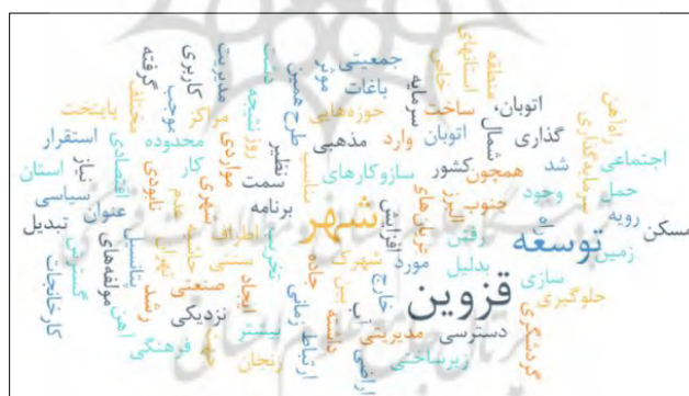
شکل ۲. ابر داده، واژگان تبیین‌کننده مرتبط با عوامل تخریب باغ‌های سنتی

علاوه بر سطح‌بندی مقوله‌ها، کدهای مفهومی و کدهای فرعی، تحلیل دیگری نیز در این پژوهش ارائه شده است که بر مبنای تحلیل واژگان مورداستفاده کارشناسان و متخصصین حوزه عوامل تخریب باغ‌های سنتی بوده است. بر این اساس ۱۱۳۴ رکورد و ۴۸۴ رتبه شناسایی شده است. از این بین تنها تا رکورد ۶۳ و رتبه ۴۵، که مهم‌ترین موارد بوده‌اند ارائه شده است. هم‌چنین، ابر داده واژگان تبیین‌کننده تخریب باغ‌های سنتی به‌قرار شکل زیر ارائه شده است.