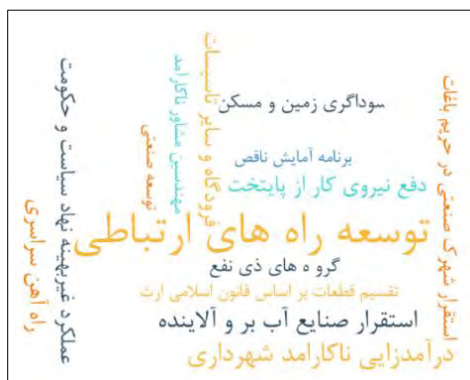
شکل ۳. ترکیبات و مقوله‌های تبیین‌کننده مرتبط با عوامل تخریب باغ‌های سنتی