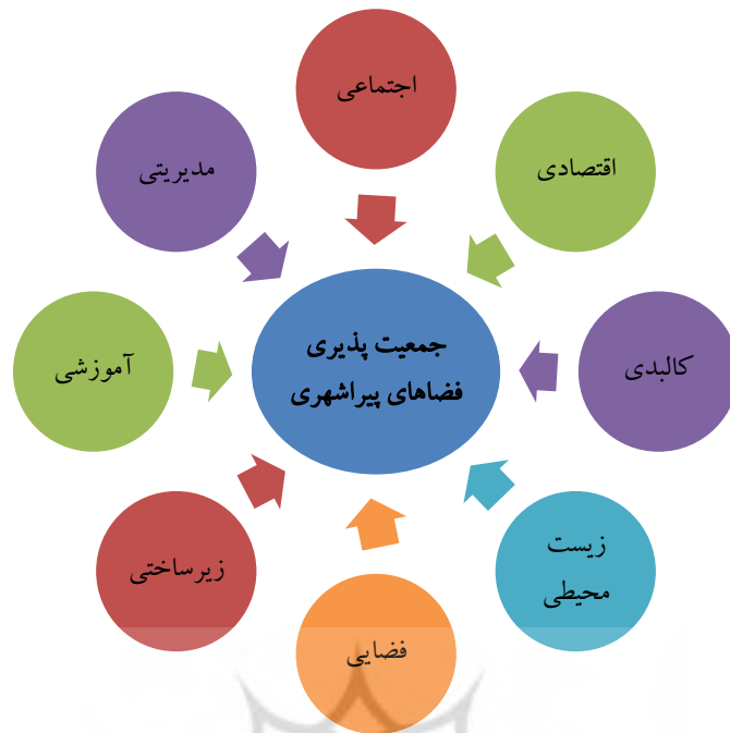
شکل ۱. مدل مفهومی پژوهش (عوامل مؤثر بر جمعیت پذیری فضاهای پیراشهری)

پژوهش حاضر است. با توجه به مطالب عنوان شده مدل مفهومی زیر را می توان برای علل مؤثر بر جمعیت پذیری فضاهای پیراشهری طراحی کرد (شکل ۱).