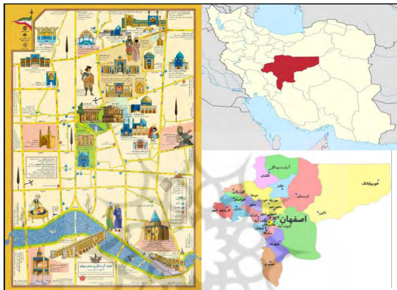
شکل ۲. موقعیت اصفهان در نقشه ایران و ۱۵ منطقه شهری اصفهان و نقشه گردشگری اصفهان

شهر اصفهان در ۴۳۵ کیلومتری تهران و در جنوب این شهر واقع شده است. شهر اصفهان با طول جغرافیایی ۵۱ درجه و ۳۹ دقیقه و ۴۰ ثانیه شرقی و عرض جغرافیایی ۳۲ درجه و ۳۸ دقیقه و ۳۰ ثانیه شمالی می‌باشد و به‌عنوان سومین شهر بزرگ ایران معرفی می‌گردد. محدوده شهر اصفهان پانزده منطقه شهری تقسیم می‌شود. شهر اصفهان شهری تاریخی در مرکز ایران است. بناهای تاریخی متعددی از جمله میدان نقش جهان، سی‌وسه‌پل، پل خواجه، عمارت عالی‌قاپو و ... دارد که شماری از آن‌ها به‌عنوان میراث تاریخی در یونسکو ثبت شده است. در شکل ۲ موقعیت اصفهان در ایران، ۱۵ منطقه شهر اصفهان و نقشه گردشگری شهر اصفهان نشان داده شده است.