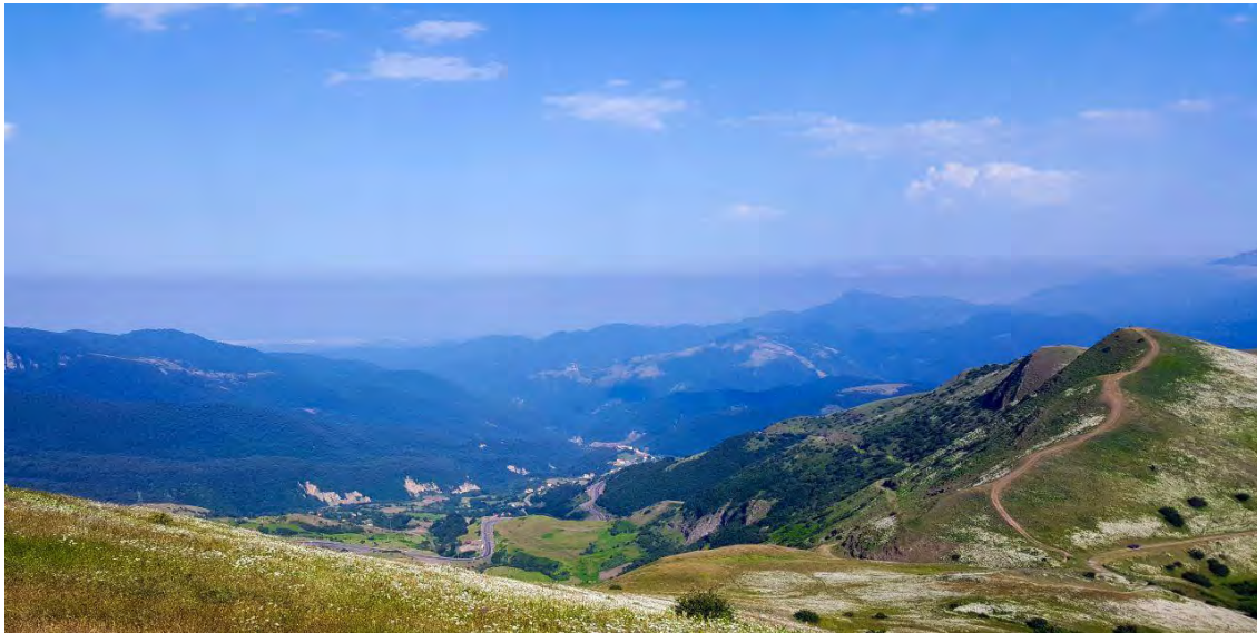
شکل ۱: نمای حیران از دشت بابونه

آبشار لاتون: در مجاورت کوه استوار اسپیناس و در میان جنگلی انبوه با گیاهان سرسبز، درختانی چون آلو، به، گلابی، گردو، فندق و سیب وحشی؛ آبشاری مرتفع و دیدنی جای گرفته است. این آبشار لاتون نام دارد و از فاصله ۵۰۰ متری نیز قابل مشاهده است. این آبشار چهار فصل و زیبا یکی از ۳۰ آبشار بلند جهان است و از بلندترین آبشارهای ایران شناخته می‌شود. ارتفاع آبریز اصلی و فوقانی آبشار لاتون ۱۰۵ متر و عرض آن پنج متر است. همچنین آبریز تحتانی لاتون ۶۵ متر با پهنای ۱۰ متر است و در مجموع ارتفاع آن به ۱۰۷ متر می‌رسد. بشار لاتون از دامنه‌های شرق کوه اسپیناس یا اسپینه سرچشمه می‌گیرد و به رودخانه لوندویل که با طول ۱۷ کیلومتر خود نیز از کوه اسپیناس سرچشمه گرفته سرازیر می‌شود و با شیب تندی به سمت کوه کومه و لوندویل حرکت می‌کند و در آخر وارد دریای خزر می‌شود. آبشار لاتون در استان گیلان، ۱۵ کیلومتری جنوب شهرستان آستارا، شهر لوندویل روستای کوه کومه جای گرفته است.