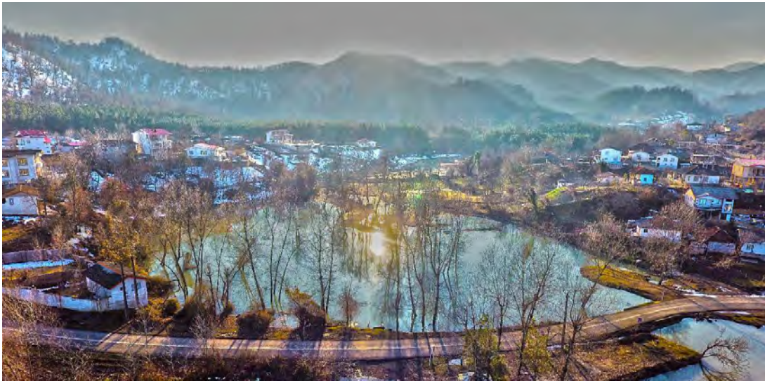
شکل ۳: تالاب استیل آستارا