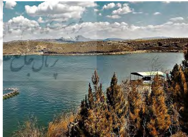
شکل ۲: تصویر منطقه شبستر، منبع: نگارندگان ۱۴۰۲