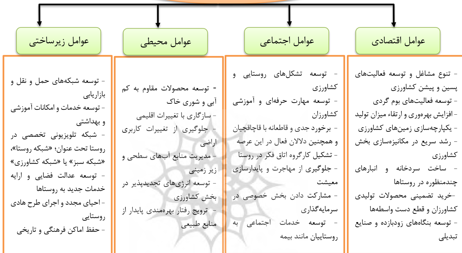
شکل (۱). راهکارهای رونق تولید در مناطق روستایی