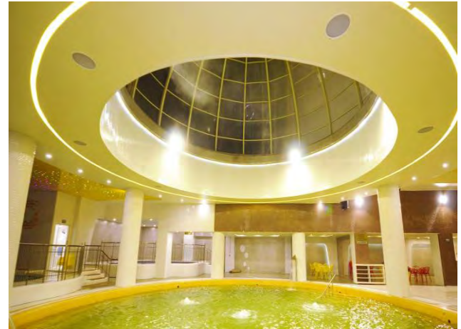
شکل (۲). تصاویر منطقه مورد مطالعه