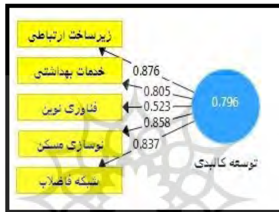
شکل ۳- بار عاملی و میزان خطای مدل اندازه‌گیری بعد توسعه کالبدی

«توسعه خدمات بهداشتی»، «افزایش بهره گیری از فناوری‌های نوین»، «نوسازی واحدهای مسکونی روستایی»، «ساماندهی شبکه دفع فاضلاب و آبهای سطحی»، نمود عینی و جغرافیایی (انعکاس) توسعه کالبدی است. از بین شاخص‌های مذکور «توسعه زیرساخت‌های ارتباطی و حمل و نقل» و «افزایش بهره گیری از فناوری‌های نوین» به ترتیب بیشترین و کمترین همبستگی با متغیر (سازه) توسعه کالبدی را در موضوع حکمروایی خوب و توسعه کالبدی دارند. بنابراین می‌توان نتیجه گرفت که این شاخص‌ها بالاترین و پایین‌ترین سهم و نقش (بار عاملی) را در اندازه‌گیری متغیر (عامل) توسعه کالبدی را به خود اختصاص داده است.