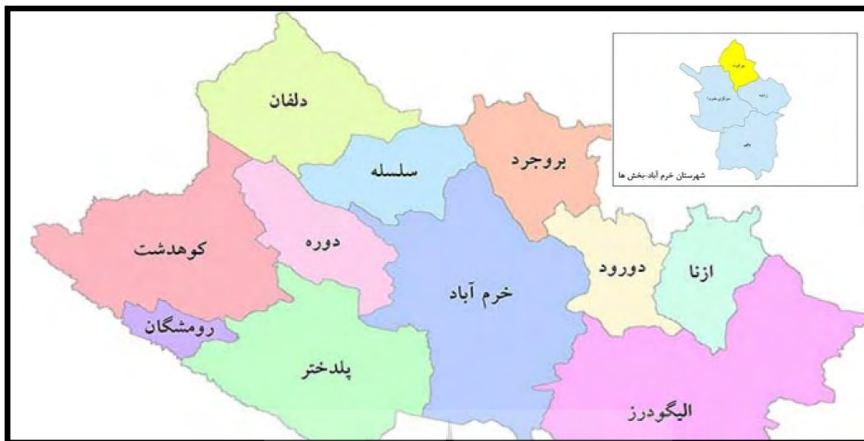
شکل ۱: موقعیت مکانی شهرستان خرم آباد