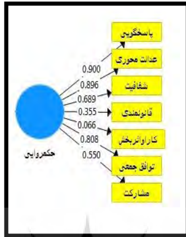
شکل ۲- بار عاملی و میزان خطای مدل اندازه گیری بعد حکمروایی خوب

و پایین ترین سهم و نقش (بار عاملی) را در اندازه گیری متغیر(عامل) حکمروایی خوب در توسعه کالبدی به خود اختصاص داده است.