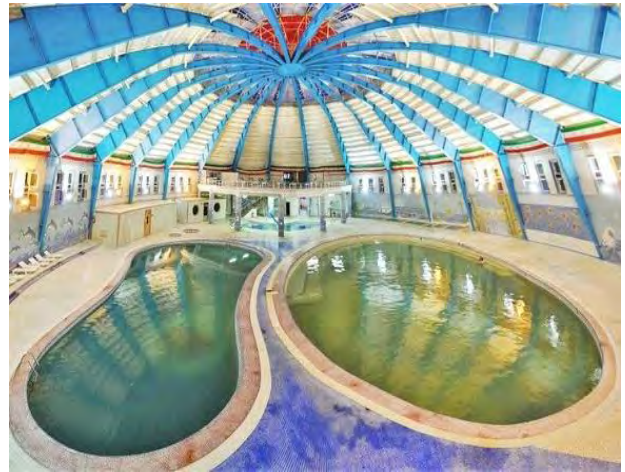
شکل (۲). تصاویر منطقه مورد مطالعه