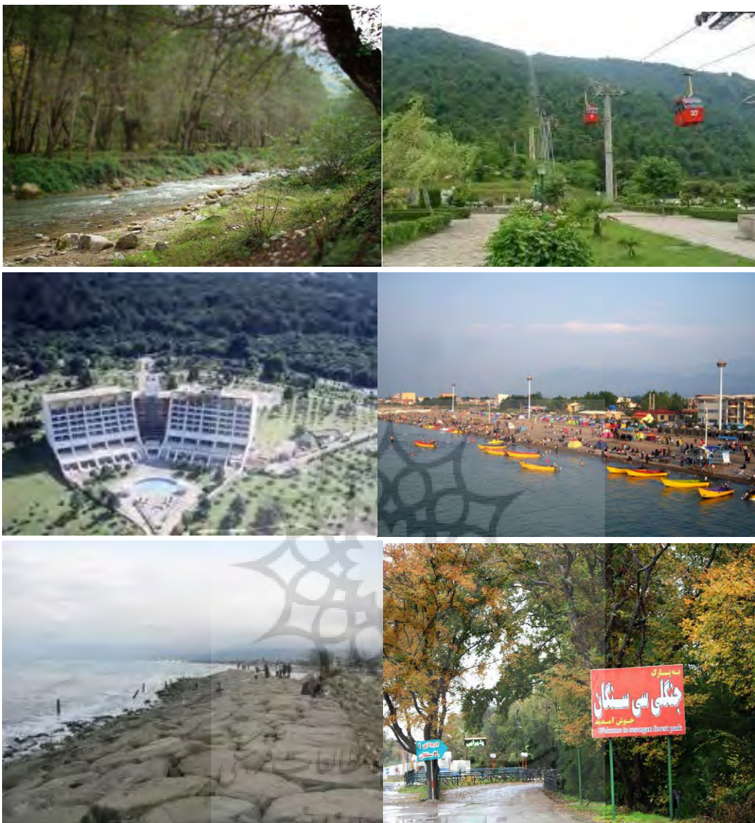
شکل ۲) شش ژئومورفوسایت ( ساحل رادیو دریا، پارک جنگلی فین، ساحل و پارک جنگلی سیسنگان، شهرک توریستی نمک آبرود، ساحل پلاژ سیترا، خط ساحلی و جنگلی هتل آزادی ( هتل هاییت سابق)