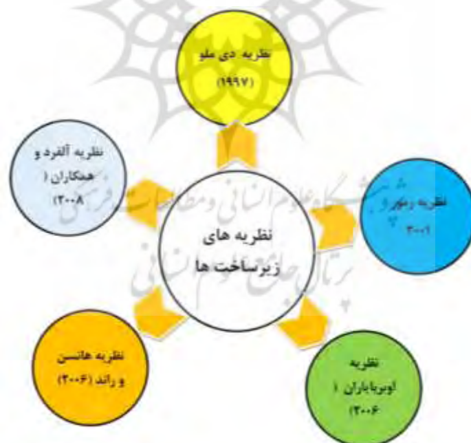
شکل ۱- نظریه‌های زیرساخت‌ها

در خصوص زیرساخت‌ها- از جمله زیرساخت‌های روستایی- نظریات مختلفی ارائه شده است. نظریه زیرساخت‌ها یکی از مهم‌ترین نظریات مرتبط با پژوهش حاضر می‌باشد. به همین دلیل این نظریه‌ها بر اساس دیدگاه محققان مختلف ارائه شده است. در شکل (۱) پنج نظریه از پنج محقق مختلف آورده شده و در ادامه هر کدام از آنها توضیح داده شده است.