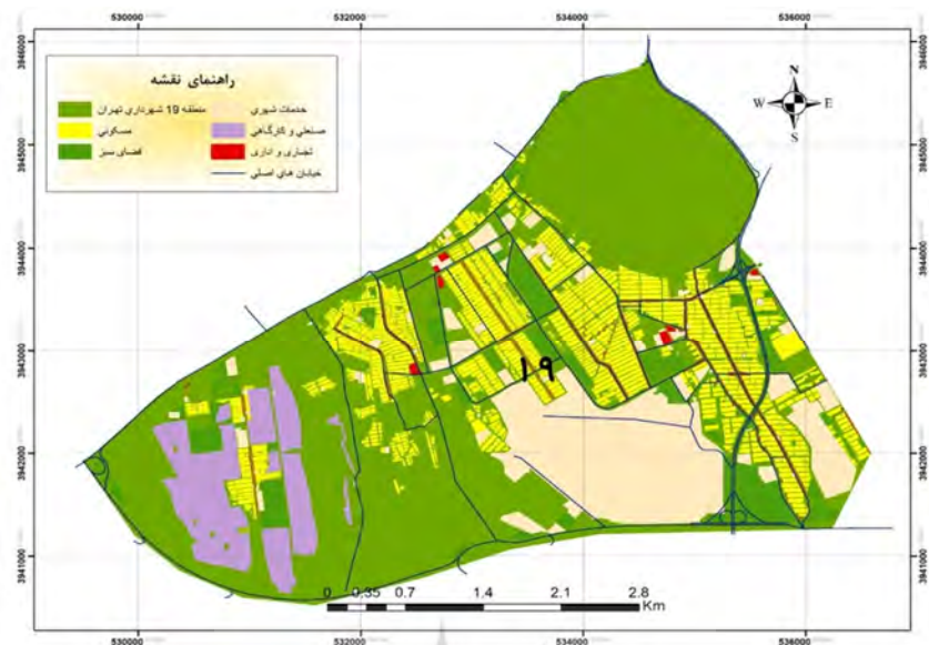
شکل شماره ۱: نقشه منطقه ۱۹ شهر تهران و کاربری های موجود (با استفاده از جی آی اس و نقشه پایه سازمان جغرافیایی)