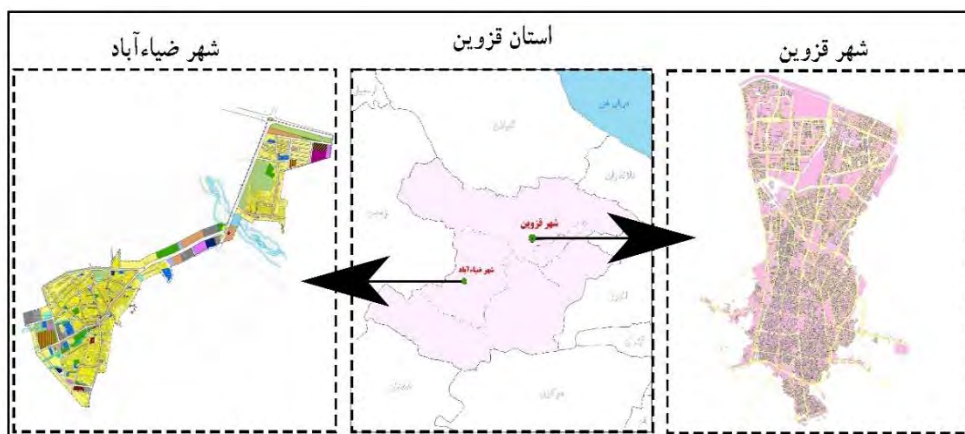
شکل ۱. موقعیت شهر قزوین و ضیاءآباد در استان قزوین