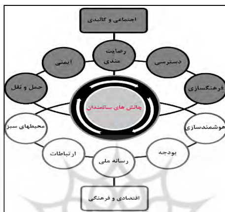
شکل ۱- مدل مفهومی تحقیق (Author Studies, 2021)