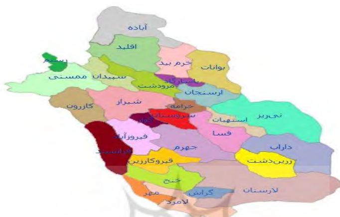
تصویر شماره ۱- محدوده مورد مطالعه استان فارس