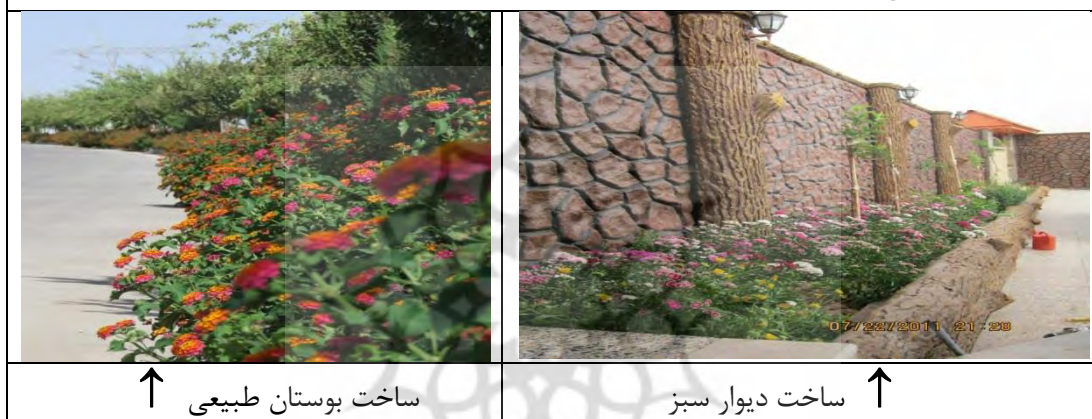
↑ ساخت بوستان طبیعی