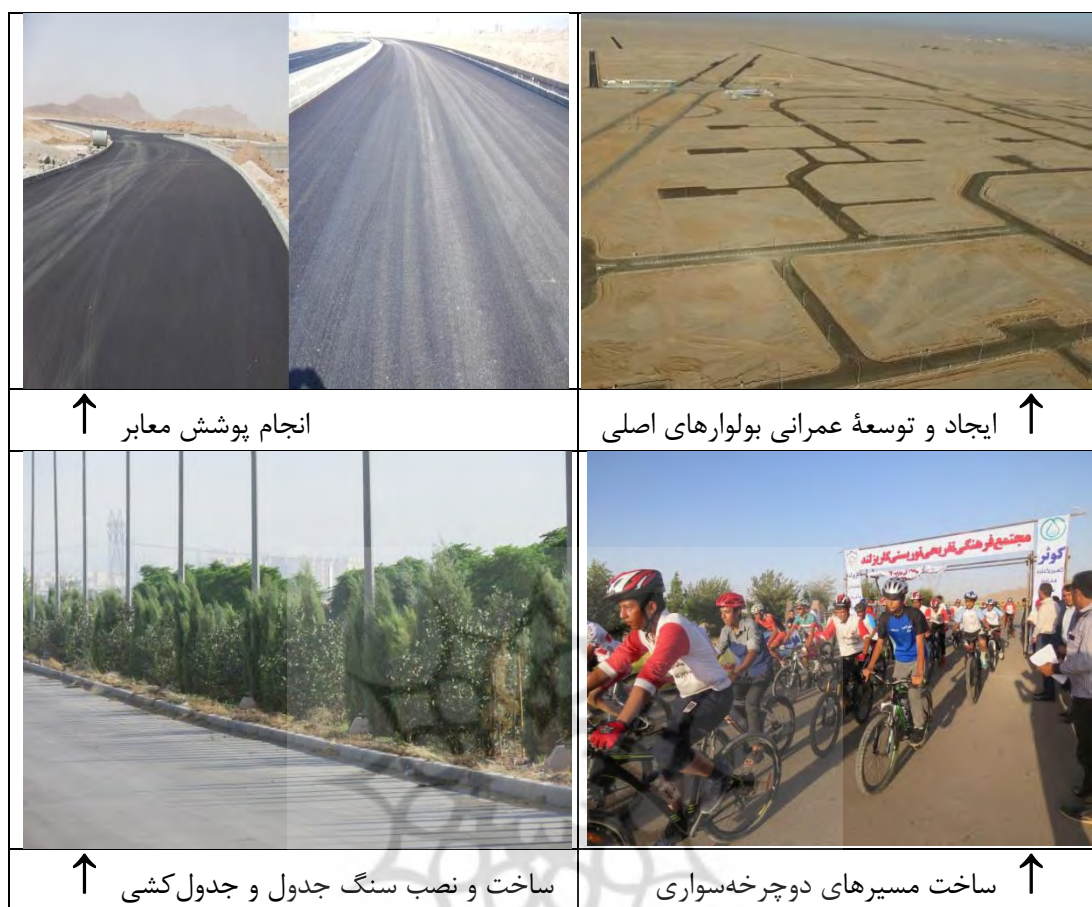
شکل ۲. اجرای برخی از زیرمعیارهای مرتبط با راه و حمل و نقل با استفاده از فاضلاب خاکستری