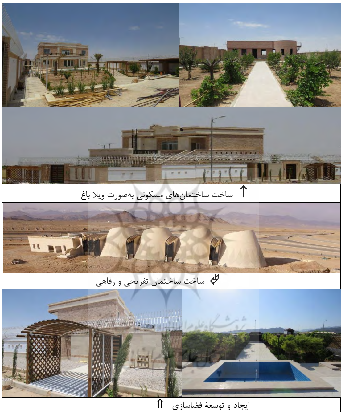
شکل ۳. اجرای برخی از زیرمعیارهای مرتبط با فضاسازی و ساختمان‌سازی با استفاده از فاضلاب خاکستری