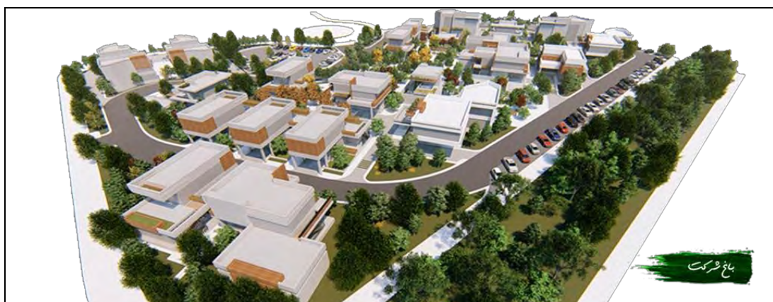
پلان سه‌بعدی جاذبه‌های گردشگری در باغشهر (در دست احداث)