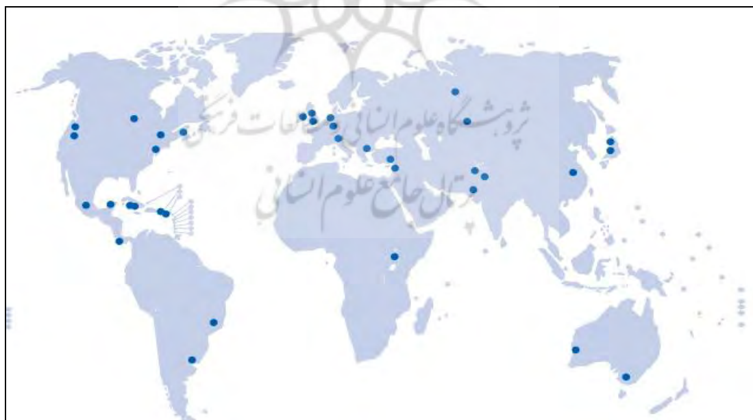
شکل ۱. پراکندگی شهرهای موفق در حوزه اجرای زیرساخت‌های شهر دوستدار سالمند

بسیاری از گفتمان‌های پیرامون پیری سالم بر حفظ ظرفیت‌های فردی با کاهش رفتارهای مخاطره‌آمیز و حمایت از مدیریت بیماری‌های مزمن متمرکز است، اما محیط‌های ساخته شده، طبیعی و اجتماعی همگی نقش مهمی دارند (Tuckett, 2014, Garin, 2015). سازمان‌های متعددی به دنبال گسترش تمرکز پیری سالم از مراقبت‌های بالینی به مداخلات بالادستی هستند، شاخص‌هایی از محیط‌های «مناسب با سن» ایجاد کرده‌اند، به‌ویژه مؤلفه‌هایی که برای اولین بار توسط سازمان بهداشت جهانی در سال ۲۰۰۷ برای کاربردهای خاص