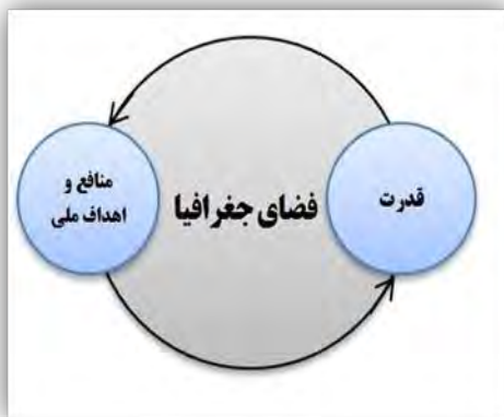
شکل (۱): رابطه قدرت و منافع و اهداف ملی

اتوتایل معتقد است کانون جغرافیا را قدرت تشکیل داد و جنگ‌های کل تاریخ برای دستیابی و کنترل سرزمین‌ها و فضای جغرافیایی در گرفته‌اند (Dougherty and Faltzgraff, 2017:176). هاوس هوفر تنها راه احیا عظمت آلمان را از مسیر تفکر ژئوپلیتیکی مبتنی بر توسعه‌ی ارضی و تنازع برای فضا می‌دانست (Nourbakhsh and Ahmadi, 2021:153). شی‌الن فضا را سرچشمه شکوفایی و قدرت دولت دانسته، دوام و بقای دولت را تنها فضایی می‌دید (Lorre and Tuval, 2002:8). و سایر اندیشمندان (جدول ۱) در نظریات خود مدعی دستیابی و کنترل بخشی از فضای جغرافیایی بوده‌اند. با این تفاسیر می‌توان گفت نظریات ژئوپلیتیکی مطرح شده از سوی اندیشمندان سیاسی عمدتاً با هدف دستیابی به راه‌کارهایی جهت افزایش قدرت ملی کشورهای خود بوده است. در این راه کلیه عناصر و ارزش‌های ساختاری و کارکردی فضای جغرافیا به عنوان منابع و منافع ملی با تاثیری که در فرایند تحقق قدرت دارند در شکل‌گیری کنش قلمروسازی ژئوپلیتیکی بازیگران سیاسی نقش آفرینند.