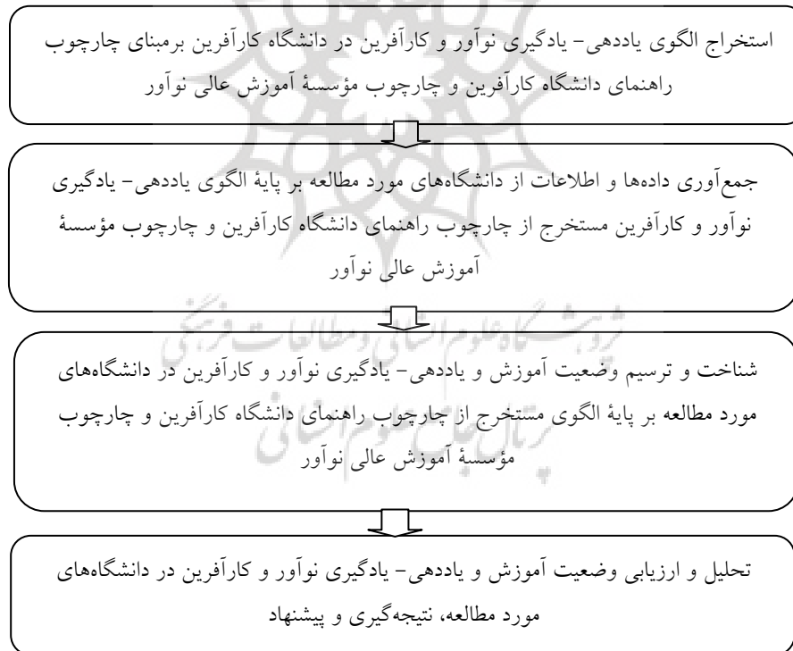
شکل ۱- فرایند و مراحل عمومی پژوهش

این پژوهش به روش تطبیقی و مقایسه‌ای انجام شده است که در آن، وضعیت آموزش و یاددهی- یادگیری نوآور و کارآفرین در دانشگاه‌های مورد مطالعه در تطبیق و مقایسه با «چارچوب راهنمای دانشگاه کارآفرین و «چارچوب مؤسسه آموزش عالی نوآور» کمیسیون اروپایی و سازمان همکاری‌های اقتصادی و توسعه، ارزیابی و تحلیل شده است (به شرح شکل ۱). دانشگاه‌های مورد مطالعه شامل پنج دانشگاه منتخب شامل دانشگاه صنعتی امیرکبیر (پلی تکنیک تهران)، دانشگاه شهید بهشتی، دانشگاه فنی و حرفه‌ای، دانشگاه جامع علمی- کاربردی و دانشگاه کاشان است. داده‌ها و اطلاعات مورد نیاز از طریق مصاحبه حضوری با مدیران ذی‌ربط نظیر دفاتر نظارت و ارزیابی، نوآوری و کارآفرینی با پرسشنامه نیمه‌ساخت یافته و اخذ اطلاعات ثبتی عملکردی نظیر کارنامه پژوهشی، رصد اخبار و رویدادها به واسطه وبگاه رسمی و رسانه‌ها و حضور در پردیس‌های دانشگاهی گردآوری، اعتباریابی و تنظیم شده است. سرانجام، بر مبنای «چارچوب راهنمای دانشگاه کارآفرین» و «چارچوب مؤسسه آموزش عالی نوآور» وضعیت یاددهی- یادگیری نوآور و کارآفرین در دانشگاه‌های مورد مطالعه در دو وضعیت توصیفی و کمی، ارزیابی و تحلیل شده است.