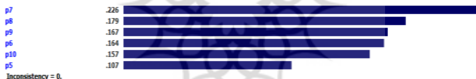
نمودار شماره ۳- مقایسه رتبه زیرشاخص‌های مؤلفه عمرانی

Priorities with respect to: Goal: تامین منابع مالی غیردولتی عمرانی >