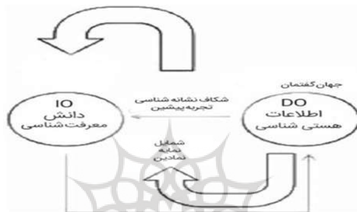
شکل ۴. مدل ارتباطی پویا (دلفسن و دیگران، ۲۰۱۸)

- اطلاعات فعال اطلاعاتی است که تفسیر می‌شود و در فرایندهای ارتباطی یا دلالتی استفاده می‌گردد. اطلاعات فعال، ماهیت و جنبه‌های معرفت‌شناسانه اطلاعات را شامل می‌شود. دلفسن و دیگران (۲۰۱۸) بر اساس مولفه‌های الگوی سه‌وجهی و ویژگی‌های آنها، و همچنین دسته‌بندی مؤلفه «شیء»؛ یک مدل ارتباطی به نام «مدل ارتباطی پویا» ارائه دادند (شکل ۴).