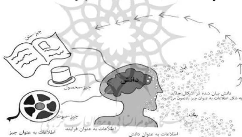
شکل ۲. سه دسته‌بندی باکلند از «اطلاعات»

باکلند (۱۹۹۱) در مقاله‌ای با عنوان «اطلاعات به عنوان چیز» اطلاعات را به سه دسته؛ «اطلاعات به عنوان چیز»، «اطلاعات به عنوان فرایند» و «اطلاعات به عنوان دانش» تقسیم‌بندی کرد. باکلند در مقالات و پژوهش‌های خود از اینکه برای تعریف مفهوم اطلاعات از نشانه‌شناسی الهام گرفته است، اشاره‌ای نکرده است؛ اما لادام ۴ (۲۰۱۱، ص. ۴۸) معتقد است که باکلند برای دسته‌بندی اطلاعات از نشانه‌شناسی بهره برده است. وی در پژوهش خود اشاره می‌کند که: «من با مطالعه بیشتر آثار باکلند به این نتیجه رسیدم که دسته‌بندی وی از اطلاعات می‌تواند به عنوان یک دیدگاه نشانه‌شناسانه از اطلاعات در نظر گرفته شود. سه دسته‌بندی باکلند به نوعی الهام گرفته شده از الگوی سه‌وجهی پرس از نشانه است». نکته‌ای که درباره دسته‌بندی باکلند باید به آن توجه داشت این است که؛ منظور وی از «اطلاعات به عنوان چیز» این نیست که همه اطلاعات چیز هستند، بلکه وی معتقد است که آنچه علم اطلاعات به ویژه در ذخیره و بازیابی به آن مرتبط است «اطلاعات به عنوان چیز» یا «بازنمون‌های دانش» است. شکل ۲، سه دسته‌بندی باکلند از اطلاعات را نمایش می‌دهد.