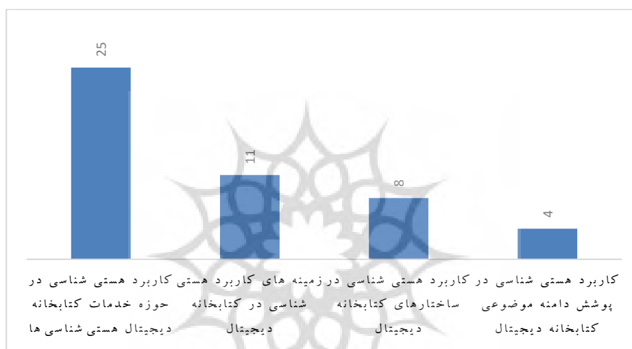
نمودار ۱. فراوانی مقولات در بین مطالعات تحلیل شده

که آنها را توصیف می‌کنند. به این ترتیب مطالعات مورد بررسی براساس تحلیل و کدگذاری در قالب ۴ مقوله، ۸ مفهوم و ۴۸ بعد تبیین شدند. از میان ۴۳ مطالعه مورد بررسی بیشترین تعداد (۲۵ عنوان) به بحث کاربرد هستی‌شناسی در خدمات کتابخانه دیجیتال پرداختند. همچنین مطالعات مربوط به زمینه‌های کاربرد هستی‌شناسی‌ها در کتابخانه دیجیتال با ۱۱ عنوان در جایگاه بعدی قرار دارند. مقالات متمرکز بر کاربرد هستی‌شناسی در ساختارهای کتابخانه دیجیتال (۸ عنوان) و کاربرد هستی‌شناسی در پوشش دامنه موضوعی کتابخانه دیجیتال (۴ عنوان) رتبه‌های بعدی را به خود اختصاص دادند (نمودار ۱).