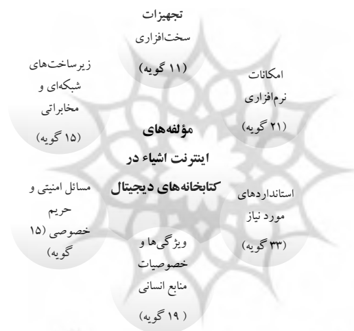
شکل ۲. مؤلفه‌ها و گویه‌های اصلی مورد نیاز

تجزیه و تحلیل، در مرحله چهارم، مبتنی بر خواندن و رمزگذاری کامل متن مقالات در نشریات منتخب است. همچنین در این مرحله، چند نشریه عمدتاً مستثنی بودند زیرا به نظر می‌رسد این مدارک تأکید متفاوتی نسبت به آنچه که در ابتداء و در چکیده مقاله آمده است، دارند. نمونه‌هایی مدارک مورد بررسی شامل ۴۴ رکورد اطلاعاتی (۲۴ مقاله ژورنالی، ۱۱ مقاله همایش و ۹ فصل از کتاب‌ها) است. در مرحله بعد، همه مقالات شناسایی شده در ابعاد مختلف طبقه‌بندی شدند. با این حال، در فرایند طبقه‌بندی، نویسندگان تغییرات را حذف کردند و مضامین ایجاد کردند تا تمامی کدهای شناسایی شده در این مطالعه را پوشش دهند. برای دستیابی به اجماع در مورد چگونگی تفسیر، برچسب‌گذاری و ساختاری مقالات استخراج شده، نویسندگان چندین جلسه ترتیب داده‌اند. در این جلسات، درک مشترک و تفاوت عقاید نویسندگان به طور گسترده مورد بحث قرار گرفت. در یک روش مشترک، نویسندگان تلاش کردند تا عوامل مختلفی را در ابعاد سطح بالاتر سازمان دهند. به طور تلویحی، ابعاد و عوامل زمینه‌سازی آن تنظیم و تجدید شکل می‌شوند تا اینکه تمام عوامل تحت پوشش قرار گیرند و نیازی به تعدیل بیشتر لازم نباشد. با الویت‌بندی به عمل آمده بر اساس فراوانی استفاده از کدها در منابع مختلف شش مولفه اصلی شناسایی شدند و بر اساس طبقه‌بندی‌ها و کد گذاری‌های فرعی یکصد و چهارده گویه به شرح شکل ۱ استخراج شدند.