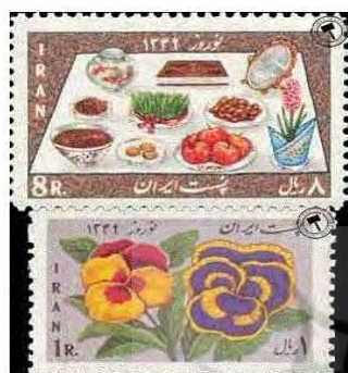
Nawruz (Festival) Postage stamp -- 1349 Print -- color

شکل ۳) ذیل تصاویر نوشته شد. علاوه بر این، روایی نمره‌گذاری‌ها (امتیازات) تعیین شده برای رتبه‌های تصاویر در نتایج بازیابی، به تأیید پنج نفر از متخصصان علم اطلاعات و دانش‌شناسی رسید. در مورد پایایی شایان ذکر است که با توجه به مشاهده‌ای بودن گردآوری داده‌ها و عدم استفاده از ابزار پرسشنامه یا چک‌لیست، به سنجش پایایی نیاز نبود. گردآوری داده‌ها با مشاهده رتبه تصاویر بازیابی شده در هر دو گروه و ثبت رتبه در یک برگه انجام شد.