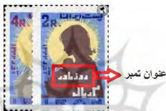
Stamp of Mother's Day

این پژوهش، از یک مجموعه تمبر شخصی انتخاب شده‌اند. دلیل انتخاب این تصاویر، کم بودن نمونه مشابه در اینترنت است تا بتوان تأثیر استفاده زبان‌های نمایه‌سازی آزاد و کنترل‌شده را بر رتبه‌بندی تصاویر در بازیابی به وسیله موتور کاوش گوگل مشاهده کرد. در این پژوهش گردآوری اطلاعات از طریق مشاهده انجام شده است. منظور از عنوان تمبر در این پژوهش عنوان درج شده در هر تمبر به وسیله وزارت پست و تلگراف و تلفن وقت (مطابق شکل ۱) و منظور از زبان آزاد ترجمه عنوان هر تمبر به زبان انگلیسی است. عناوینی که بر اساس زبان کنترل‌شده در این پژوهش استفاده شده‌اند، با همکاری و مشورت ویراستاران اصطلاح‌نامه مواد گرافیکی کتابخانه کنگره آمریکا تهیه شده است.