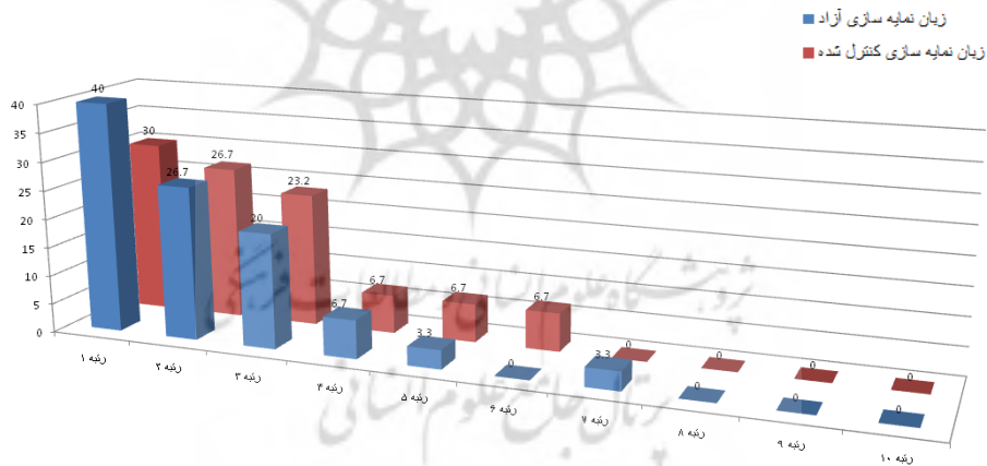
نمودار ۲. مقایسه درصد فراوانی رتبه نتایج جست‌وجوی تصاویر بر اساس زبان نمایه‌سازی آزاد و کنترل‌شده