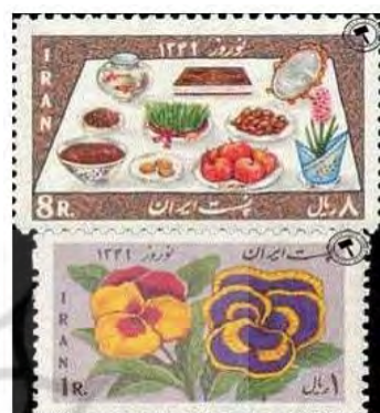
Stamp of Norouz 1349

شکل ۲. نامگذاری تصویر بر اساس زبان شکل ۳. نامگذاری تصویر بر اساس زبان کنترل شده نمایه‌سازی آزاد جدول ۱ عناوین تمبرها را نشان می‌دهد. این عناوین شامل عنوان تمبر به زبان فارسی، عنوان تمبر بر اساس زبان آزاد و همچنین عنوان تمبر بر اساس زبان کنترل شده است.