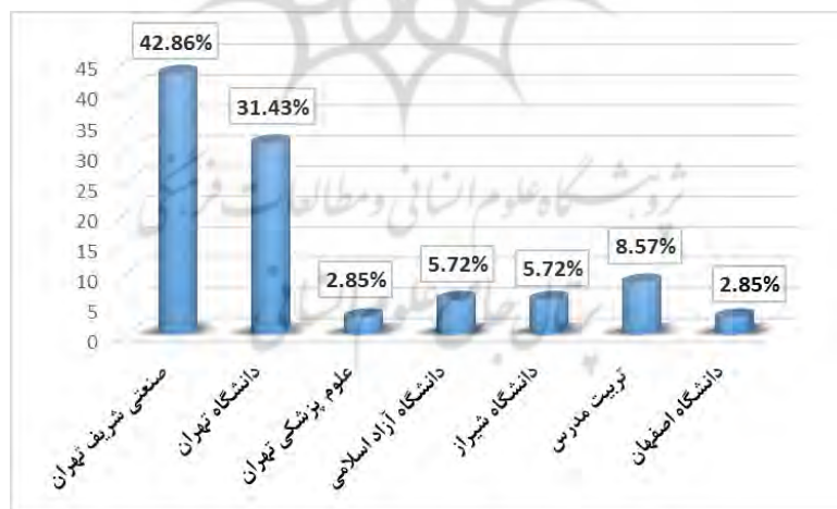
نمودار ۳. بسامد دانشگاه‌ها قبل از مهاجرت (تعداد= ۳۵)

پرسش سوم. دانشگاه مبدأ این اعضا قبل از مهاجرت به آمریکا، کدام دانشگاه‌ها بوده‌اند؟ متأسفانه با توجه به اطلاعات در دسترس از طریق رزومه و سایت این افراد، امکان تعیین محل تحصیل تمام مقاطع تحصیلی پیشین آنان وجود نداشت و تنها در مورد ۳۵ نفر چنین کاری میسر بود. در میان این افراد، دانشگاه صنعتی شریف تهران، دانشگاه تهران، تربیت مدرس، دانشگاه شیراز، دانشگاه آزاد اسلامی، دانشگاه اصفهان و دانشگاه علوم پزشکی تهران، دانشگاه‌های مبدأ مهاجران بوده‌اند.